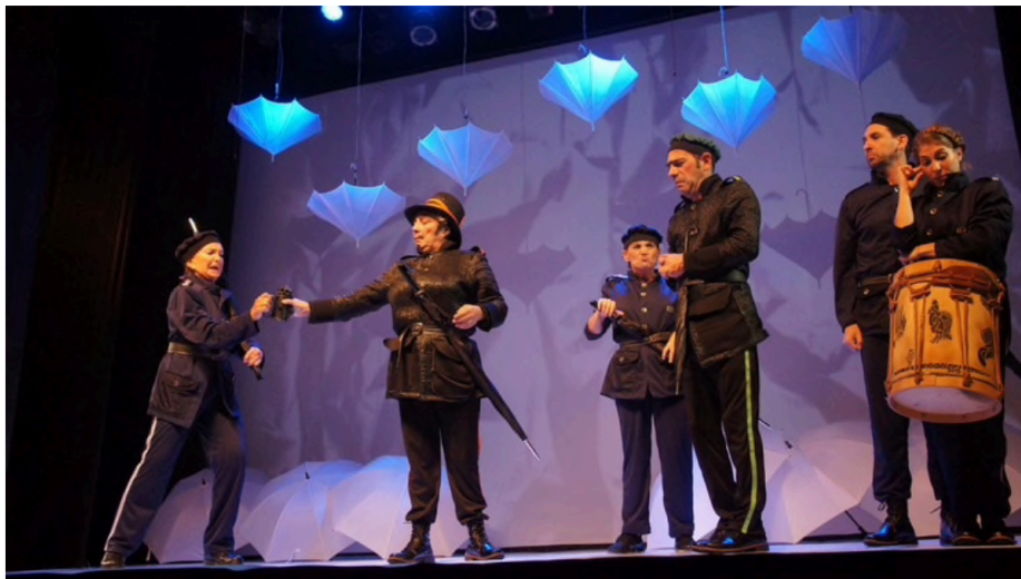
"Mucho Ruido y Pocas Nueces" en el Teatro La comedia

La versión de Mucho Ruido y Pocas Nueces que presentamos los martes 20.30 hs en el Teatro La comedia es el resultado de un trabajo mancomunado de artistas y técnicos profesionales, que aportan su talento y esfuerzo en busca de la excelencia. Estamos orgullosos de haber concebido este proyecto en el que se han involucrado en forma directa e indirecta alrededor de 60 personas del quehacer teatral.